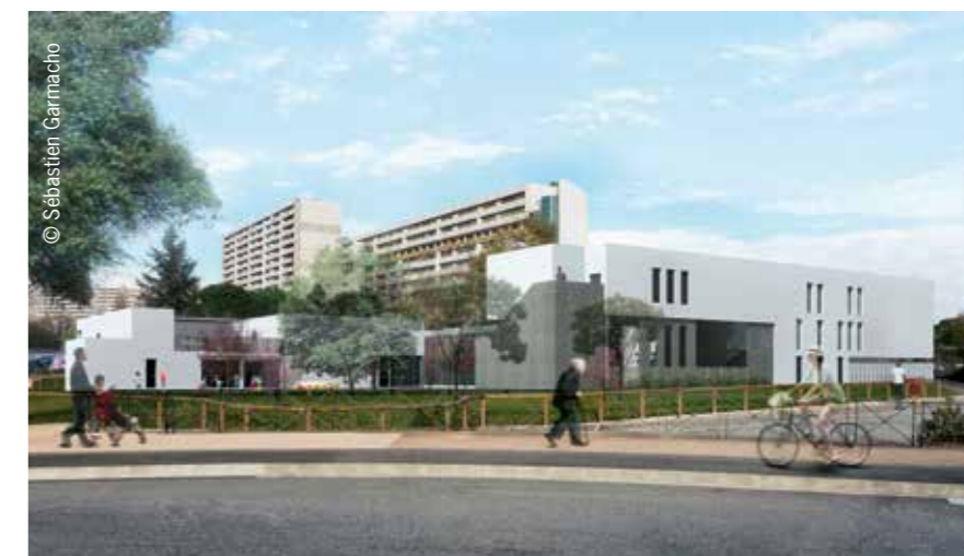
Le futur groupe scolaire de la Reynerie.

Dans le quartier de la Reynerie, les travaux de construction du groupe scolaire qui va remplacer la maternelle Auriacombe et l'élémentaire Galia viennent de débiter. Cet édifice contemporain disposera de 5 classes de maternelle et de 11 classes d'élémentaire. L'opération représente pour la Mairie de Toulouse un investissement de 9,8 M€. Cet établissement ouvrira ses portes pour la rentrée de septembre 2018.